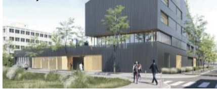
Collège Niki de Saint Phalle Nancy